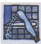
Baden / Duschen